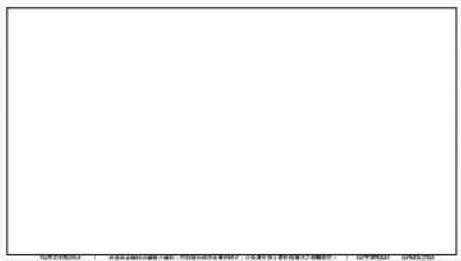
多益成績單.pdf 多益成績證明